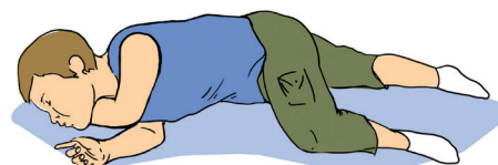
Устойчивое боковое положение